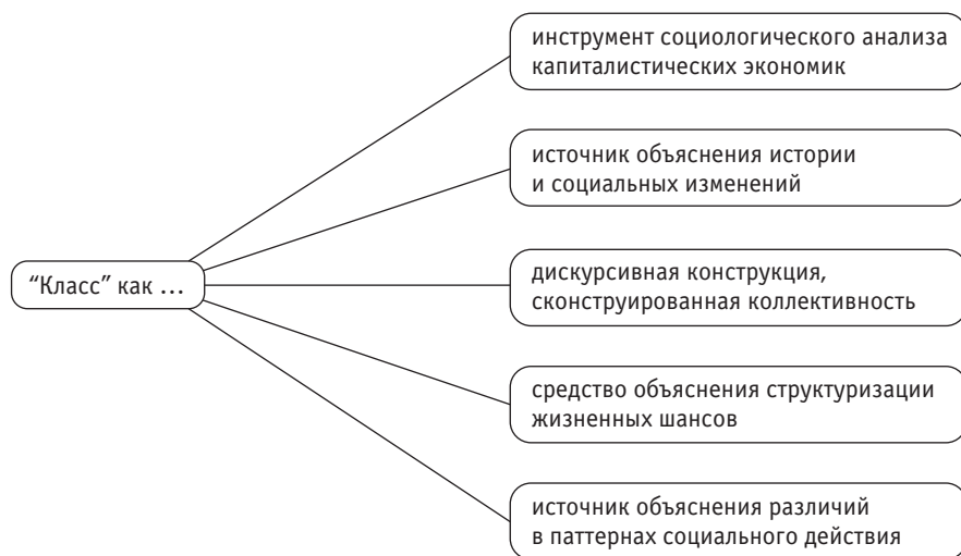
Рис. 2. Тематические кластеры классового анализа (Горан Терборн)

Согласно Терборну, эти пять тематических кластеров, в разное время имевших наибольшее значение для классовых аналитиков, актуальны и для современного классового анализа. Он считает, что многообещающей исследовательской программой для интересующихся классом ученых будет движение в направлении, противоположном локальному сужению до масштаба занятий (как в концепции Граски и Уиден), — в направлении сравнительных исследований классовых культурных восприятий, дискурсивных и политических стратегий в различные периоды и на различных континентах, а также изучения, с одной стороны, интерфейсов национальных социально-экономических расслоений, институтов и распределительных процессов, а с другой — глобальных либо транснациональных потоков и исторических условий.